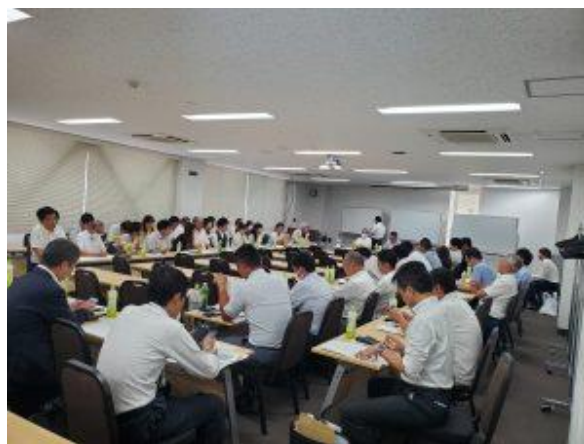
（情報交換会の様子）