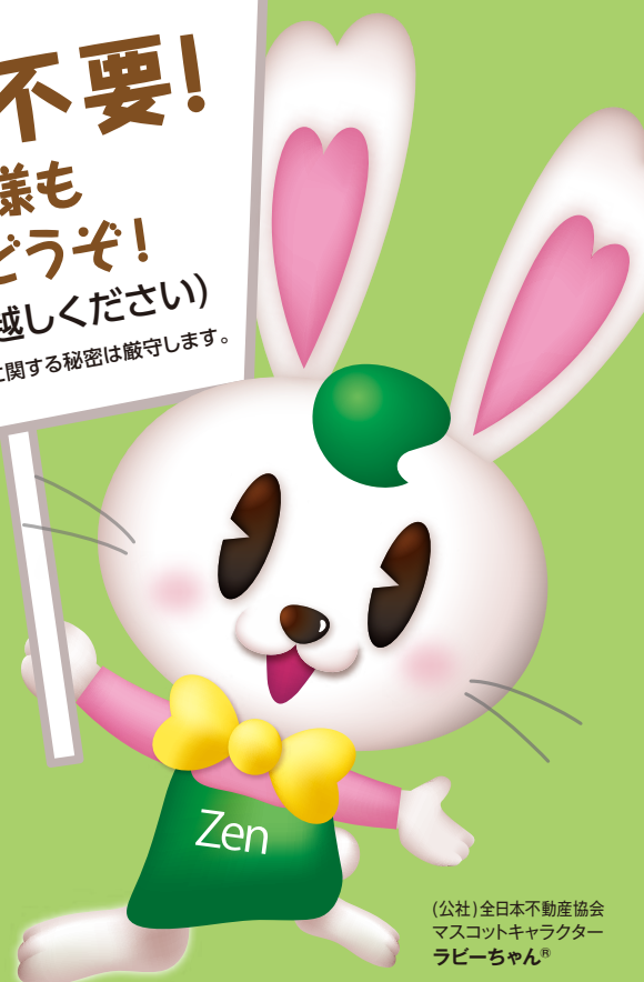
(公社)全日本不動産協会 マスコットキャラクター ラビーちゃん®

※予約不要（上記会場に直接お越し下さい） ※天候等により中止となる場合がございます。