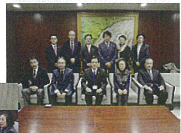
▲吉住区長と新宿支部役員