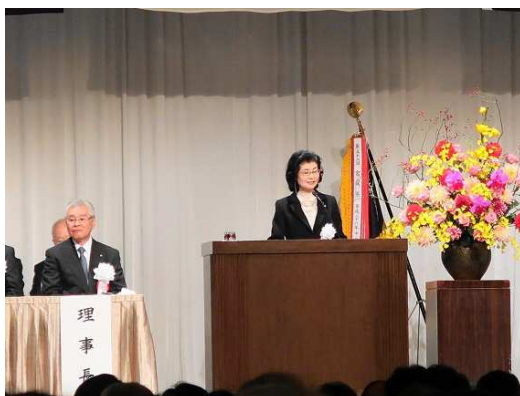
【全国不動産会議 宮城県大会】