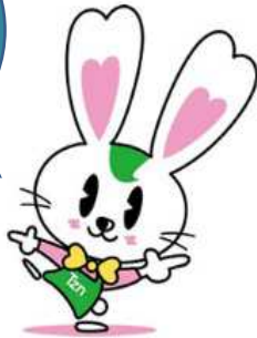
全日本不動産協会東京都本部 マスコット ラビーちゃん