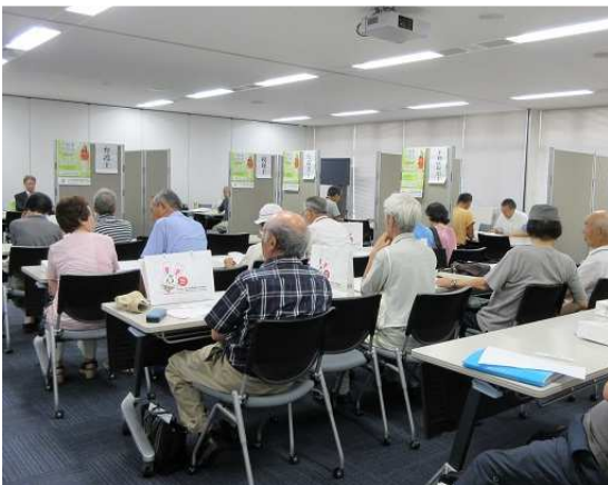
【平成 28 年度不動産無料相談会】