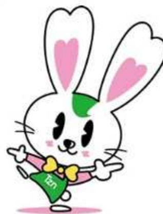
全日本不動産協会東京都本部 マスコット ラビーちゃん