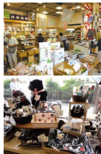
(上) 約1000点の商品を取り扱っています。 (下) ご存知くまのグッズも大人気。