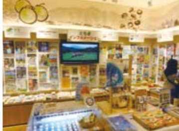
(上) 明るく、気軽に入りやすい店内。 (下) 観光情報コーナーも充実。

東京スカイツリーの開業当時にお膝元の商業施設ソラマチ・イーストヤード4階に、栃木県の「とちまるショップ」があります。栃木県としては初のアンテナショップです。平日でも約6000人、土日では約9000人の来訪者があるそうです。もっともこれでもスカイツリーに比べるとまだまだ少ないです。