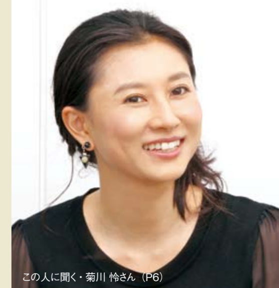
この人に聞く・菊川 怜さん (P6)