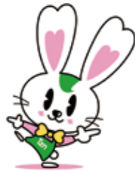
東京都本部マスコットキャラクター「ラビー」