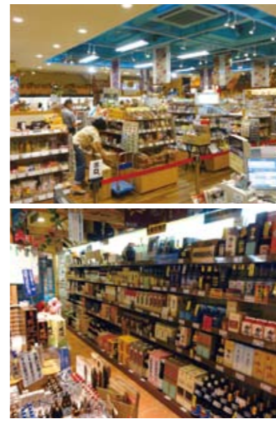
(上) 市場にいるような感覚で、さまざまな発見を楽しもう。 (下) 地下1階には、充実の泡盛コーナーも。