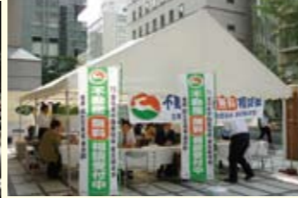
不動産街頭無料相談会