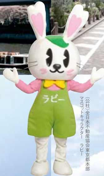
(公社)全日本不動産協会東京都本部 マネージャー 谷花音