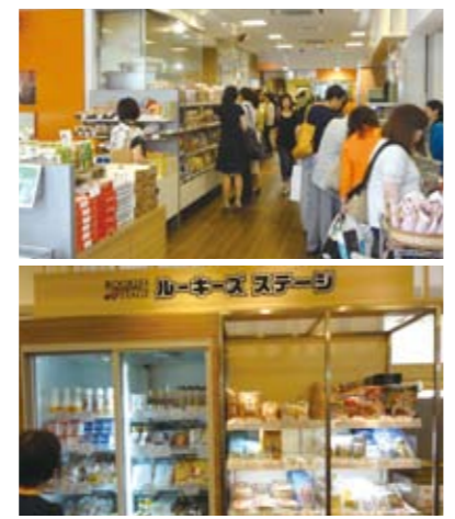
(上) 店内はいつも多くの買い物客で賑わっています。 (下) 新しい味を発見できるルーキーズステージ。

交通会館1階にある、1999年オープンの「北海道どさんこプラザ」は、食品を中心に約1000品目を取り扱っており、年間200万人以上が訪れる人気のアンテナショップです。商品は、北海道の定番お菓子や水産加工品が約50%を占めています。店内では「ルーキーズステージ」にも注目です。また、お土産として約100種類の商品が3カ月ごとに入れ替わり、売れ上り数で順位がつけられ、最後まで上位だった商品のみが定番商品となることができます。ここから新たなヒット商品が生まれるかもしれません。