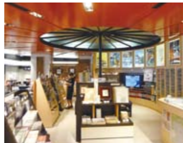
(上) 店内には工芸品を中心にさまざまな商品を揃える。 (下) 情報コーナーは、野点傘をイメージした作り。

東京駅八重洲口の正面にあるのが、京都市のアンテナショップ「京都館」。2006年に赤坂から移転し、オープンしました。伝統工芸品を中心に、お菓子や食品、地酒なども含め1000種類以上の商品が揃っています。毎月、伝統工芸品の美観販売などのイベントも開催しています。9月の工芸品の特集は、龍村美術織物を取り上げる予定です。京都館は、観光だけでなく、文化、教育、衣食住に至るまで、あらゆる「京都情報」を発信しています。京都旅行前に来て情報収集する方も多いそうです。