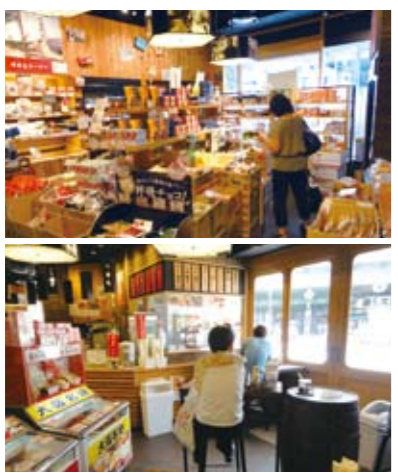
(上) 内装のイメージは「古きよき、かっこいい大阪」。 (下) 店内のイトインスペース。夜は立ち飲み居酒屋に。

〒100-0006 東京都千代田区有楽町2-10-1 交通会館1F ◎10:00～22:00 元日 ◎03-5220-1333 http://www.osaka-hyakkaten.jp/