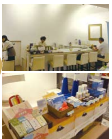
(上) 落ち着いた雰囲気静岡茶を味わう。 (下) 世界遺産登録で湧く富士山グッズも充実。

交通会館地下1階にあるのが「Shizuoka Mt.Fuji Green-tea Plaza」。静岡県観光案内所は、2011年11月にリニューアルオープンしました。日本茶インストラクターが常駐(12:00～17:30)しており、店内のカウンターで静岡茶とお菓子のセットがいただけます。気に入ったお茶は、店頭で購入することも。店内では、不定期に地元自治体による「産物産展」が開催されています。世界遺産登録された富士山クッキーも充実しており、あの「富士山カラー」も好評販売中。