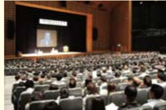
法定研修会(東京国際フォーラム)

また、東日本大震災後には、被災者支援を目的に義援金の拠出や行政からの協力要請に基づく被災者の住宅確保の協力を行いました。