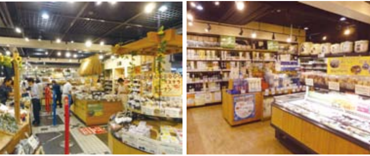
(左) 年間100万人の来訪者を誇る人気アンテナショップの1つ。 (右) 美味しい地酒も充実しています。