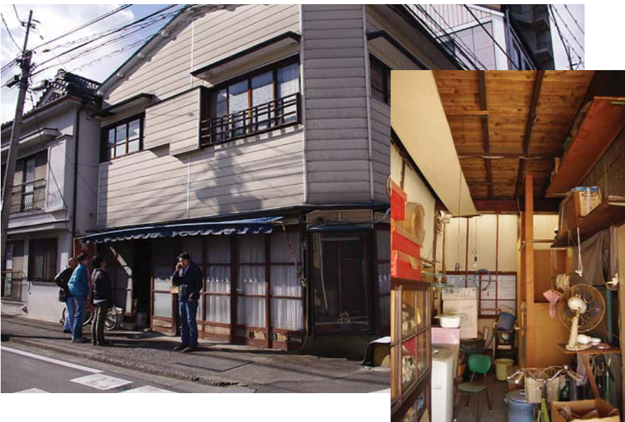
元染物店(10年間無人)