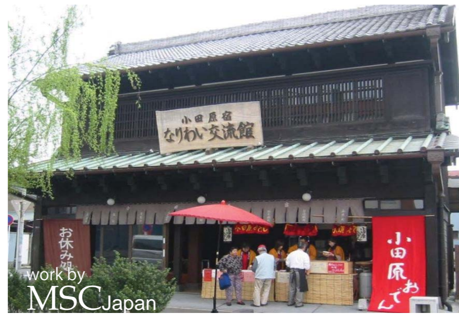
小田原宿なりわい交流館