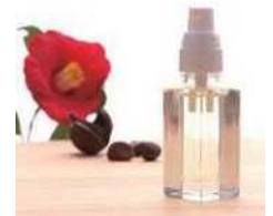
大島の特産品「つばき油」

太平洋上にならぶ大島、利島、新島などを中心とした伊豆諸島、さらに南にある父島、母島などを中心とした小笠原諸島を合わせて島しょ部とよぶよ。それぞれの島の自然環境を生かした特産品がつくられているんだ。中でも小笠原諸島は、ここでしか見られない生き物などがいて、世界自然遺産に登録されている。東京港から父島まで、船で片道約24時間もかかるよ。