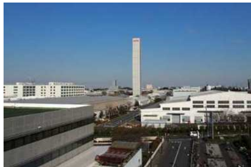
多摩地域の機械工場