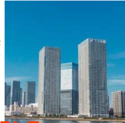
東京湾岸の高層マンション