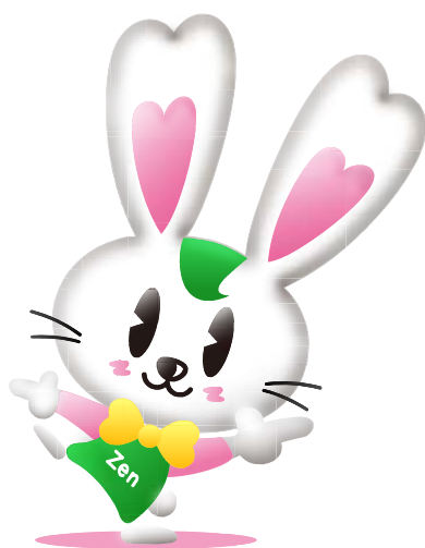
マスコットキャラクター ラビーちゃん