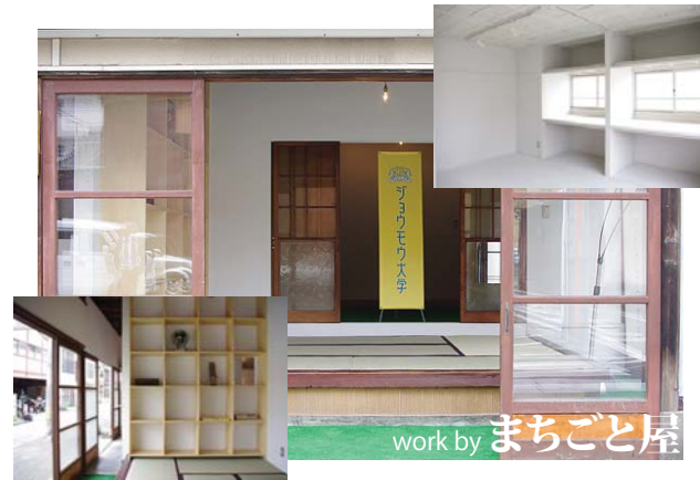
Motokonya(地域交流拠点) work by まちごと屋