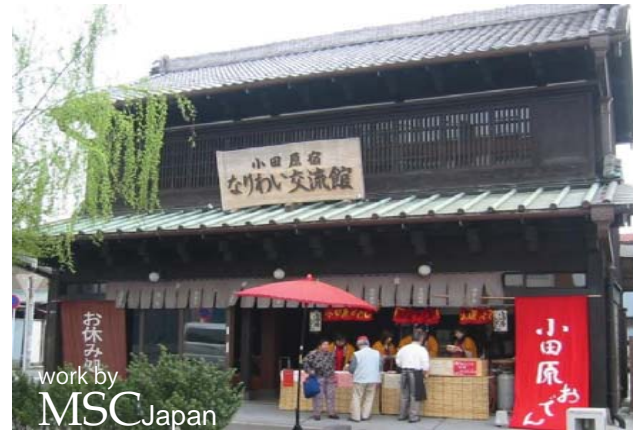
小田原宿なりわい交流館 work by MSCJapan