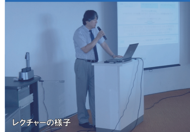
レクチャーの様子

※ ワorkshopでのアドバイスをもとに、参加者それぞれのプロジェクトの中間報告を講師全体に対して行い、講師から講評と次回までの課題を提示します。