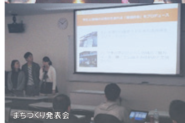
まちづくり発表会