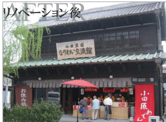
リノベーション後