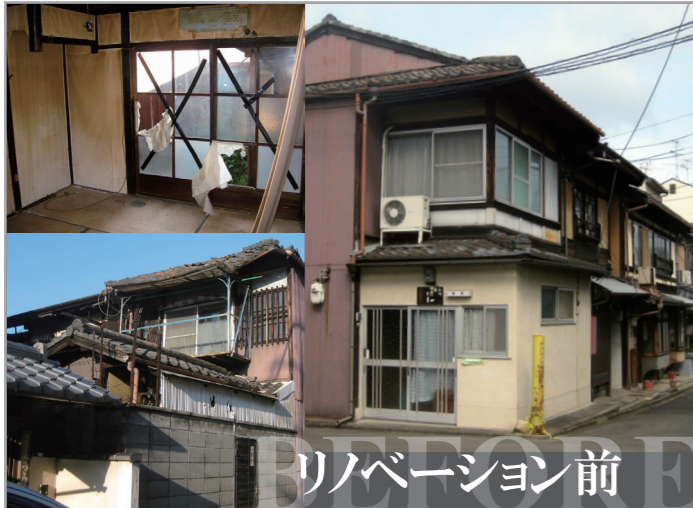
リノベーション前