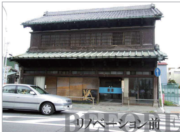
リノベーション前