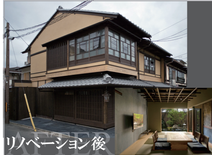
リノベーション後