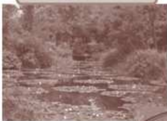
モネの庭マルモッタン

フランスの画家、クロードモネの自宅庭園を再現した、世界で唯一名称を譲り受けた庭園です。