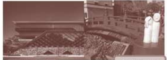
高知城歴史博物館