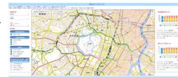
土地・不動産情報ライブラリ(仮称)表示イメージ

※不動産の購入者からのアンケート結果に基づき国土交通省が「土地総合情報システム」において提供